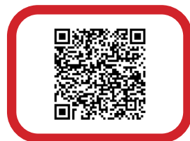
På vår webbplats finns anmälningslänk & mer info Senaste dag för anmälan: 12 /9