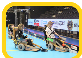
Elinnebandy – fartfylld idrott som du får möjlighet att prova på i samband med konferensen!